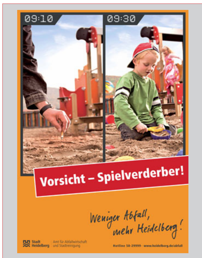
Abbildung 3: Plakatkampagne in Heidelberg zur Sauberkeit auf Spielplätzen