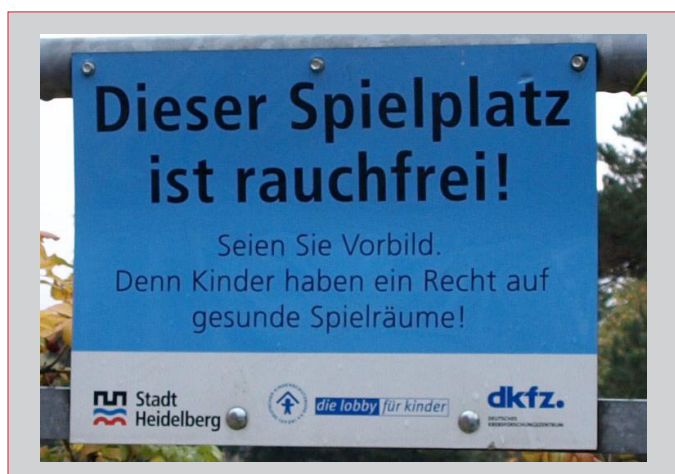
Abbildung 2: Rauchverbotsschild an einem Spielplatz in Heidelberg

Das kommunale Rauchverbot in Heidelberg scheint also eine hohe Wirksamkeit zu haben, während in Würzburg trotz bayernweiten Rauchverbots auf Spielplätzen etwa dreimal so viele Kippen zu finden waren wie in Heidelberg. Im Oktober 2009 waren auf den Würzburger Spielplätzen sogar fast so viele Kippen pro Spielplatz zu finden wie in Mannheim, wo es kein Rauchverbot auf Spielplätzen gibt. Der Grund für die geringere Wirksamkeit der Rauchverbotsregelung in Würzburg im Vergleich zu Heidelberg liegt darin, dass in Heidelberg an 9 der 10 besuchten Spielplätze ein gut sichtbares Rauchverbotsschild aufgestellt war (Abb. 2), während in Würzburg keinerlei Beschilderung vorhanden war. Es ist davon auszugehen, dass das bayerische Rauchverbot auf Spielplätzen in Würzburg kaum bekannt ist, während in Heidelberg nahezu jeder Spielplatzbesucher mit einem Schild auf das Rauchverbot hingewiesen wird. Darüber hinaus wurde in Heidelberg Mitte 2009 eine Plakatkampagne gestartet, welche die Verschmutzung öffentlicher Plätze anprangert und unter anderem auch das Problem von Kippen auf Spielplätzen thematisiert (Abb. 3). Die Untersuchung belegt, dass ein Rauchverbot auf Spielplätzen nur wirksam ist, wenn es durch entsprechende Maßnahmen (wie Beschilderung oder Kampagnen) kommuniziert wird. Denn erst durch Hinweisschilder oder Plakate werden Raucher beim Besuch eines Spielplatzes auf ihre Verantwortung gegenüber den Kindern aufmerksam gemacht.